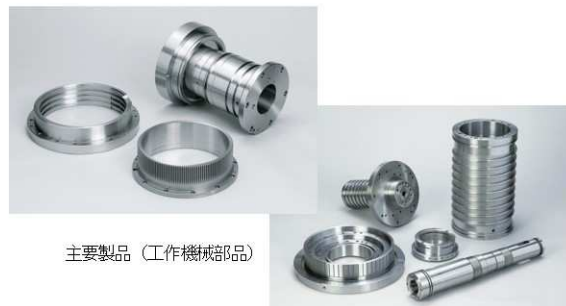
主要製品（工作機械部品）

商号：株式会社 サンエイ精機 所在地：石川県かほく市遠塚口27 ☎ 076-285-1728 設立：1973年3月 資本金：4,600万円 事業内容：精密機械部品加工業 URL： http://www.san-ei-seiki.co.jp/